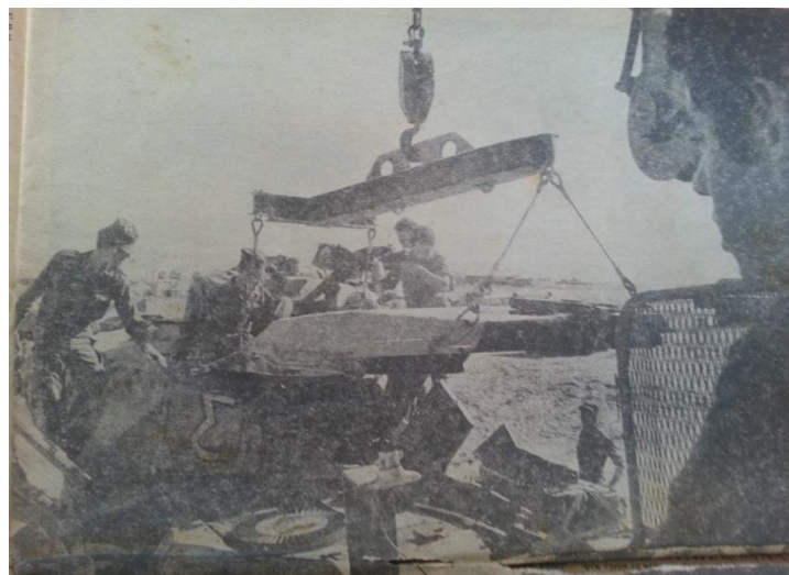
החלפת חטיבת כוח של הטנק על ידי חייליו של גש"ח במהלך מלחמת יום כיפור.